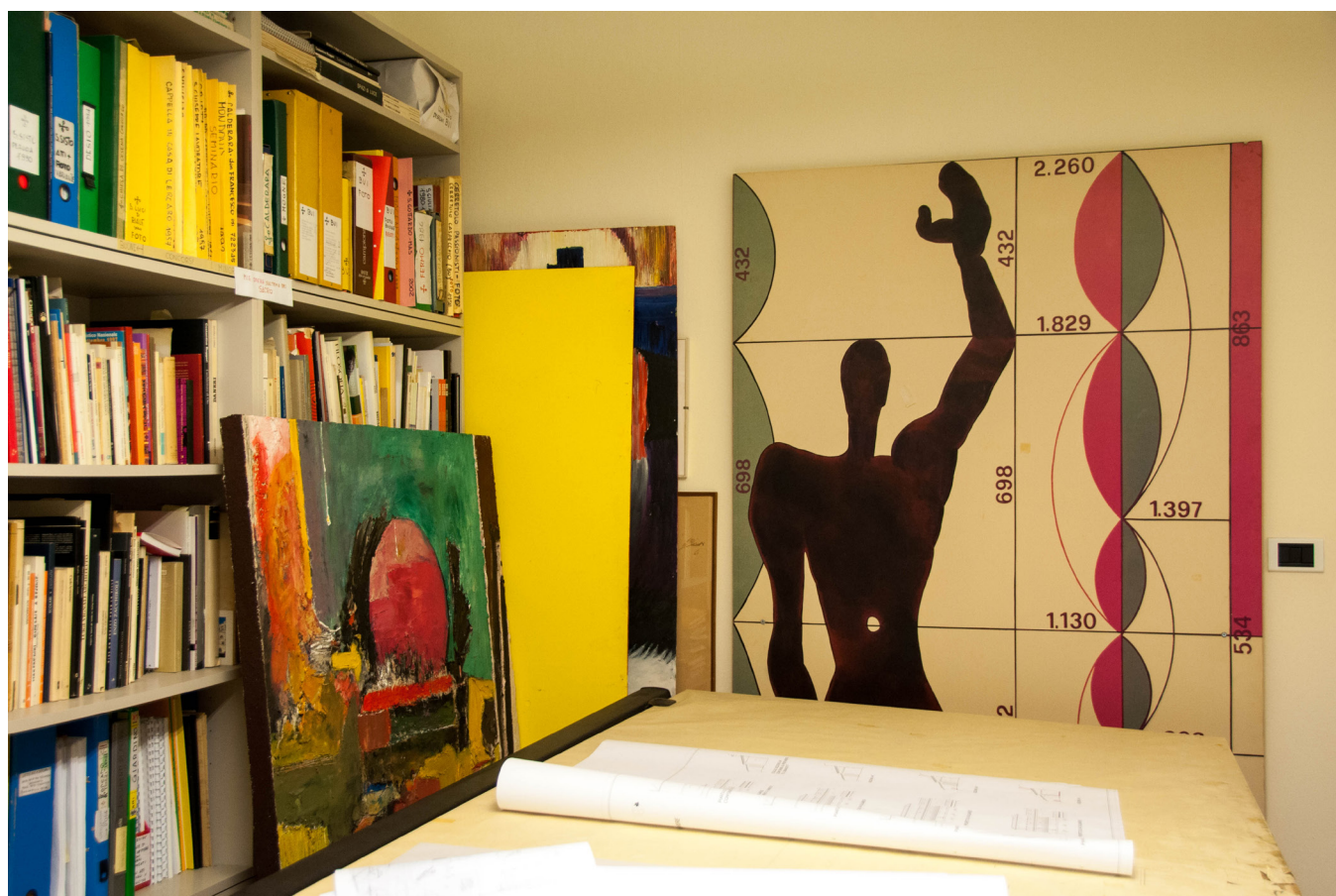
Biblioteca di Glauco Gresleri, Bologna.