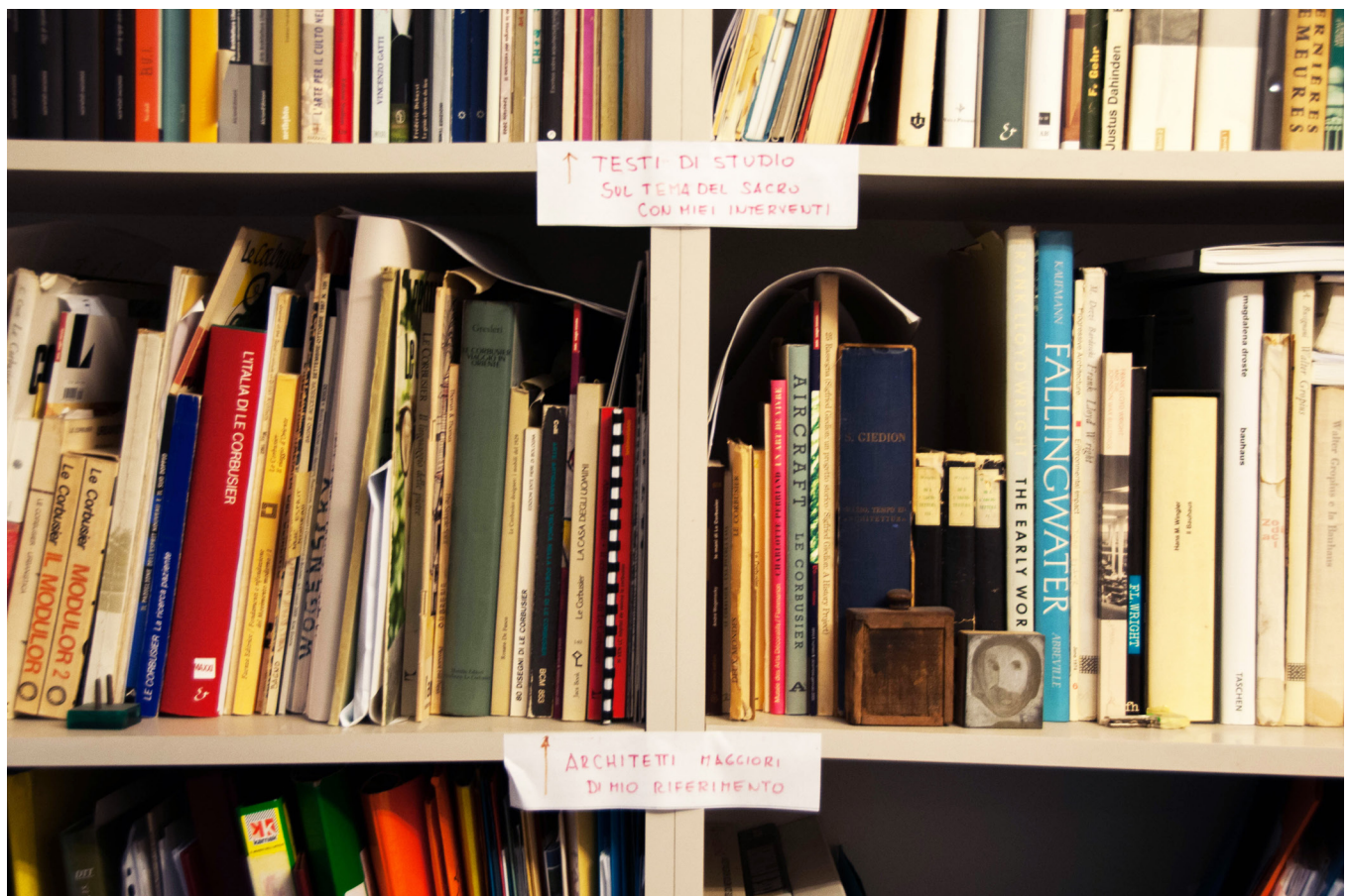
Biblioteca di Glauco Gresleri, Bologna.