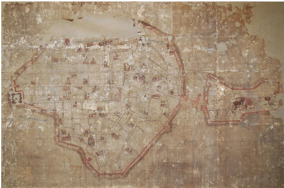
2 Terezio Manzoni, La pianta di Faenza , 1565. Faenza, Archivio Capitolare.

successore, Annibale Grassi, nel 1576. 14