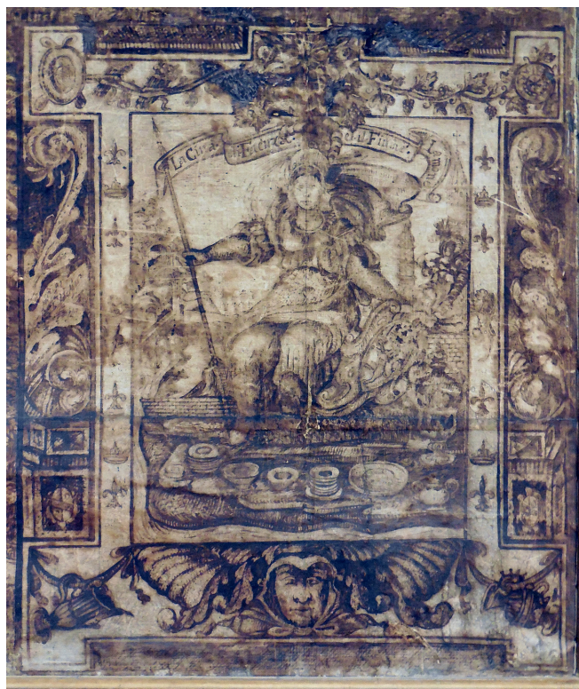
8 Virgilio Rondinini, Planimetria Faventiae , 1630, dettaglio della personificazione di Faenza. Faenza, Biblioteca Comunale.

Le due rappresentazioni urbane presentate (oltre a quella perduta del 1556) documentano diversi aspetti dei rapporti tra la città di Faenza, l'autorità ecclesiastica e il senso del Sacro. La rappresentazione della città nella pianta Carafa doveva essere finalizzata a meri scopi militari e politici: dunque Faenza si confrontava con il papato come città suddita, pura pedina strategica utile alle ambizioni dei nipoti di Paolo IV. La pianta Manzoni, invece, si inserisce pienamente in un'ottica controriformistica: la rappresentazione cartografica è strumento dell'opera di rin-