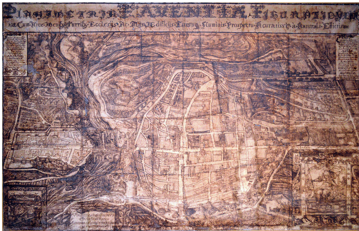
7 Virgilio Rondinini, Planimetria Faventiae , 1630. Faenza, Biblioteca Comunale.