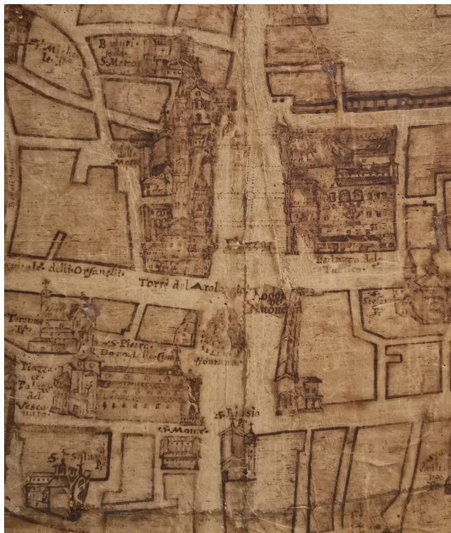
7 Virgilio Rondinini, Planimetria Faventiae , 1630, dettaglio del Palazzo Comunale. Faenza, Biblioteca Comunale.

un particolare legame di soggezione della città, e soprattutto della sua famiglia, nei confronti del papa.